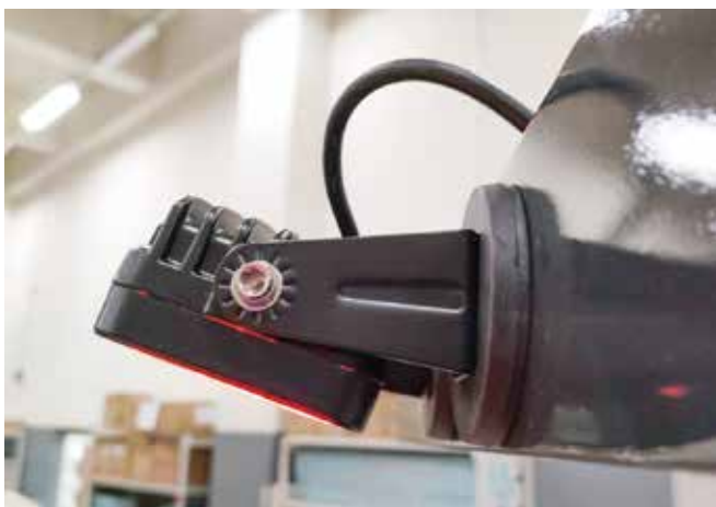
マグネットで簡単取り付け